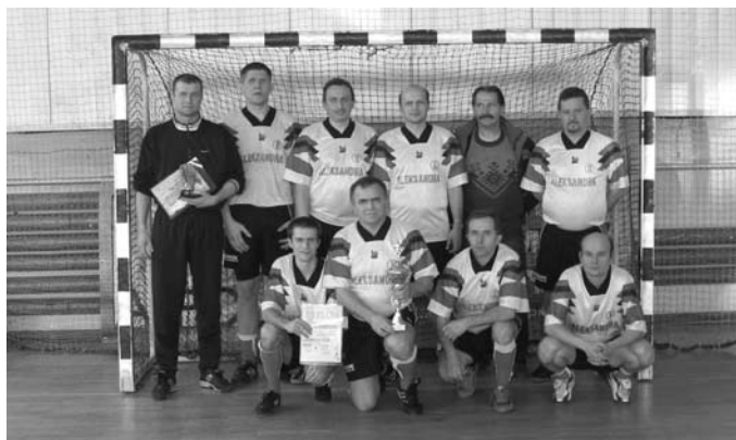
Mistrzowska Drużyna Oldbojów

Dzięki lepszej różnicy bramek wojkowiczanie zajęli pierwsze miejsce w swojej grupie i w finale pokonali "Concordię" Knurów 5 : 2.